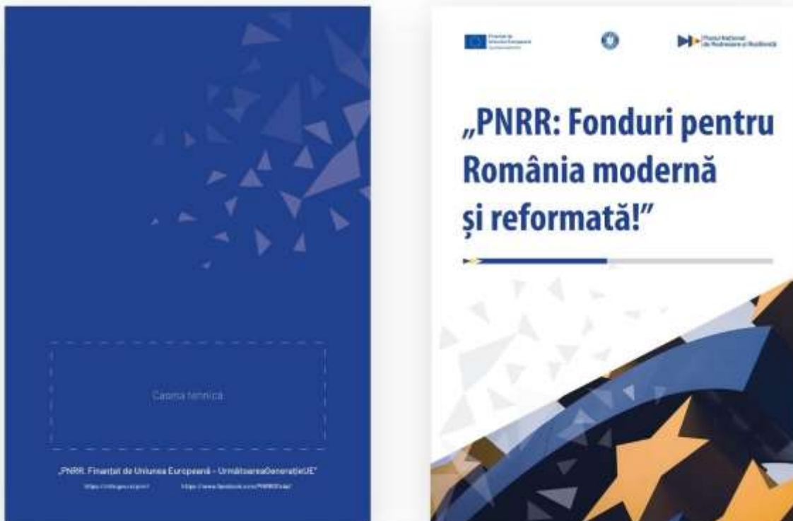
Fig. 3 Broșură (coperta 1 și coperta 4)

Pe coperta 4 a broșurii sau pagina de exterior la pliant se va insera caseta tehnică (vezi mapă) și, la final, textul: Material distribuit gratuit.